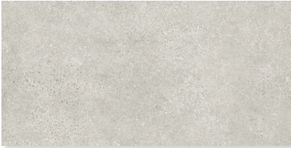
600x1200x9,5 mm Rett.