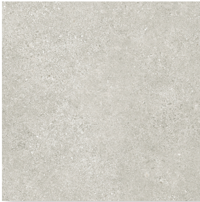
1200x1200x9,5 mm Rett.