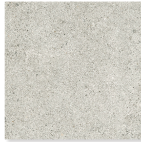
800x800x9,5 mm Rett.