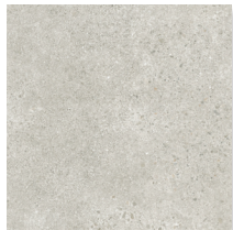
600x600x9,5 mm Rett.