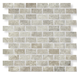
1803-0019 Ginepro Mosaico Brick