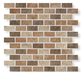
1803-0021 Curry Mosaico Brick