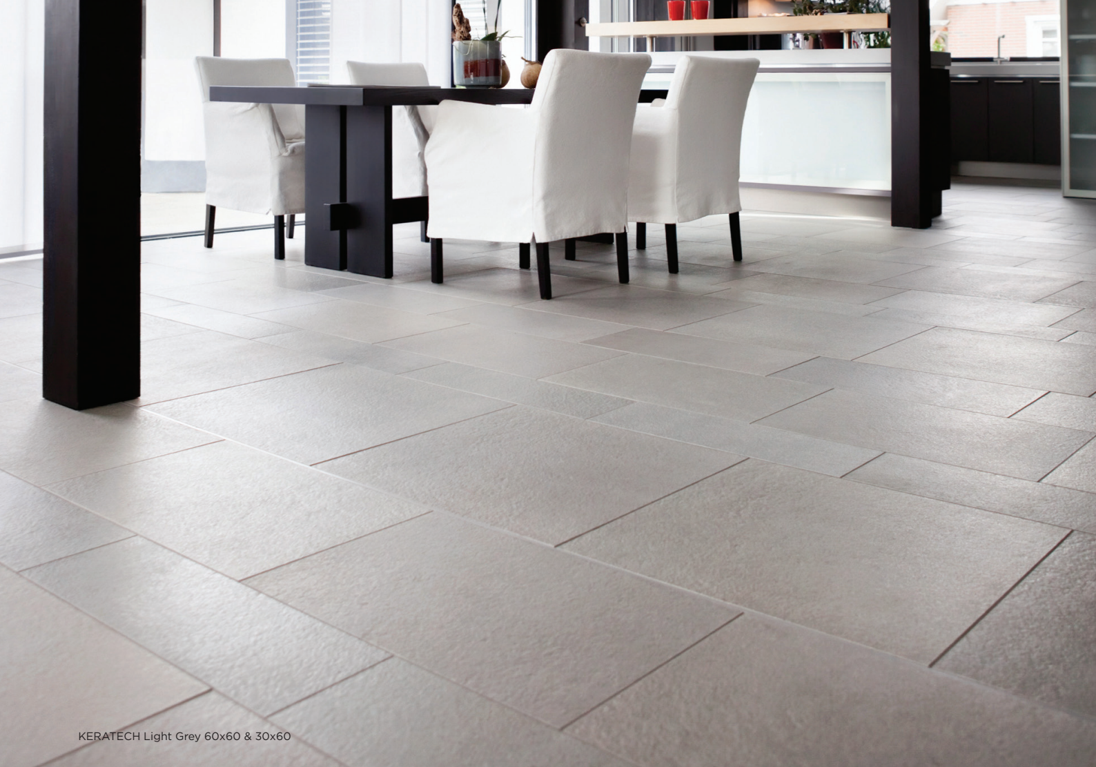
KERATECH Light Grey 60x60 & 30x60