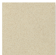
Naturele R10 A