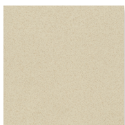
Grip Plus R11 B