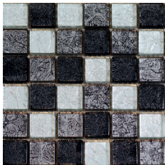
1838-0001 Black & White 72M