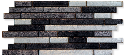
1838-0006 Black & White 72M