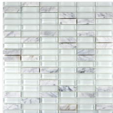
1838-0023 Stick White Mix 68M