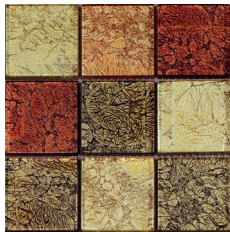
1838-0004 Brown & Yellow 72M