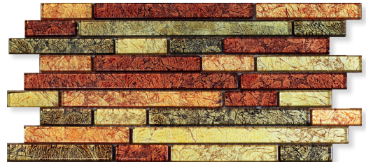
1838-0007 Brown & Yellow 72M