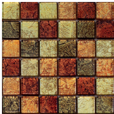
1838-0002 Brown & Yellow 72M