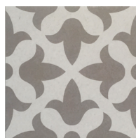
1062-0016 Champagne Grey, matt 28M