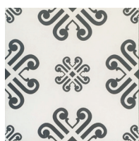
1062-0005 Perugia, matt 28M