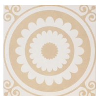
1062-0020 Bourgogne Beige, matt 28M