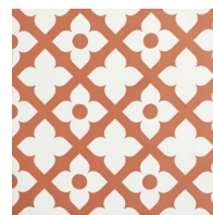
1062-0007 Firenze, matt 28M