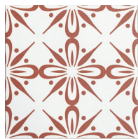
1062-0011 Milano, matt 28M