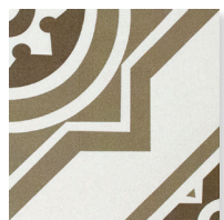
1062-0002 Pisa 28M 4 st för helt mönster