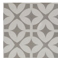
1062-0015 Normandie Grey, matt 28M