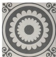
1062-0014 Bourgogne Black, matt 28M