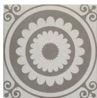
1062-0017 Bourgogne Grey, matt 28M