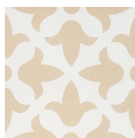
1062-0019 Champagne Beige, matt 28M