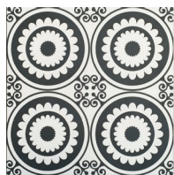
1062-0003 Roma, matt 28M