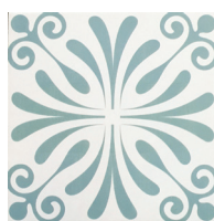
1062-0006 Siena, matt 28M