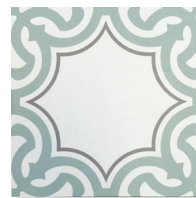
1062-0008 Napoli, matt 28M