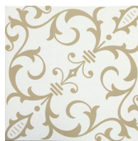
1062-0004 Verona, matt 28M