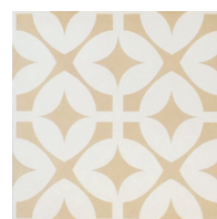
1062-0018 Normandie Beige, matt 28M