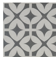
1062-0012 Normandie Black, matt 28M

Antique kan kombineras med Keratech (sida 64-65)