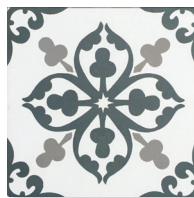
1062-0010 Assisi, matt 28M