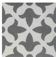
1062-0013 Champagne Black, matt 28M