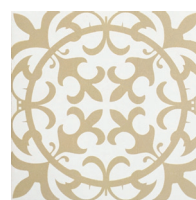
1062-0009 Bologna, matt 28M