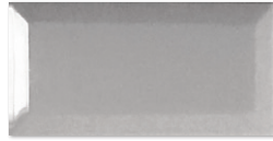
1508-0030 Gris Perla Glossy