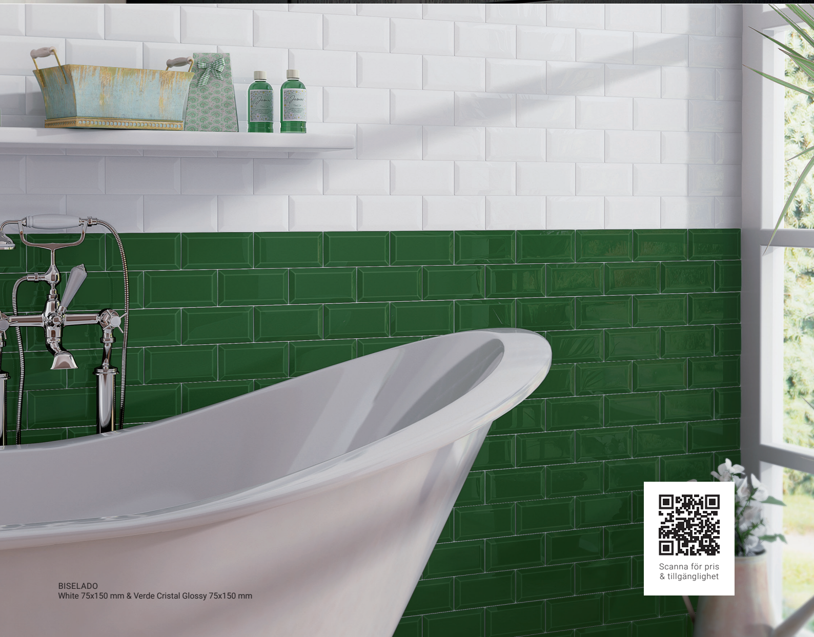
BISELADO White 75x150 mm & Verde Cristal Glossy 75x150 mm