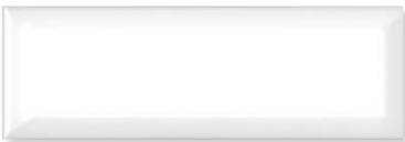
1508-0024 White Glossy

OBS! Verde Cristal kan krackelera vilket är en del av produkttegenskaperna. Sura rengöringsmedel får ej användas på plattan.