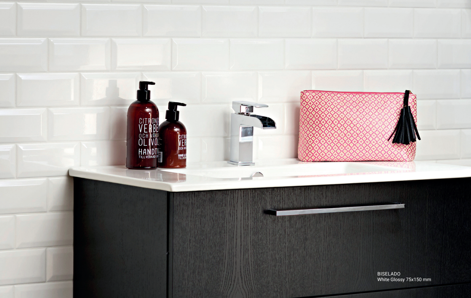
BISELADO White Glossy 75x150 mm