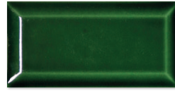
1508-0029 Verde Cristal Glossy