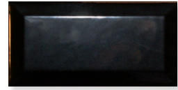
1508-0020 Black Glossy