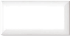
1508-0028 White Mat