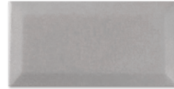
1508-0031 Gris Perla Mat