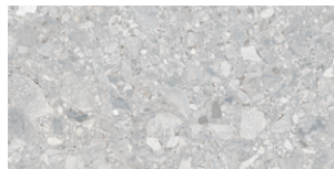
1864-0007 Grey 1864-0008 Mink