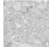
1864-0040 Grey 1864-0041 Mink