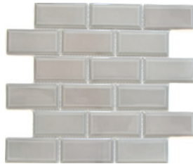
1853-0004 Metro Grey Glossy