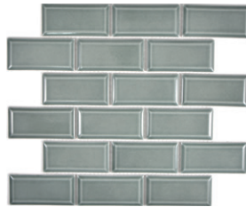
1853-0003 Metro Petrol Glossy