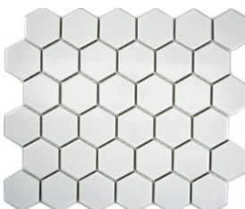
1853-0005 White Glossy

HEXAGON 51X59X5 mm Arkstorlek 325x281x5 mm