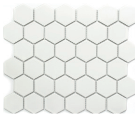
1853-0006 White Matt