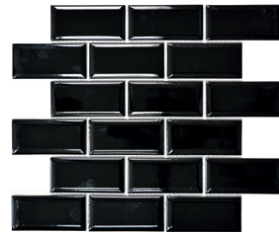
1853-0001 Metro Black Glossy