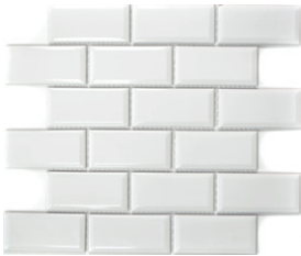
1853-0002 Metro White Glossy

45x95x6,5 mm Arkstorlek 295,5x291x6,5 mm