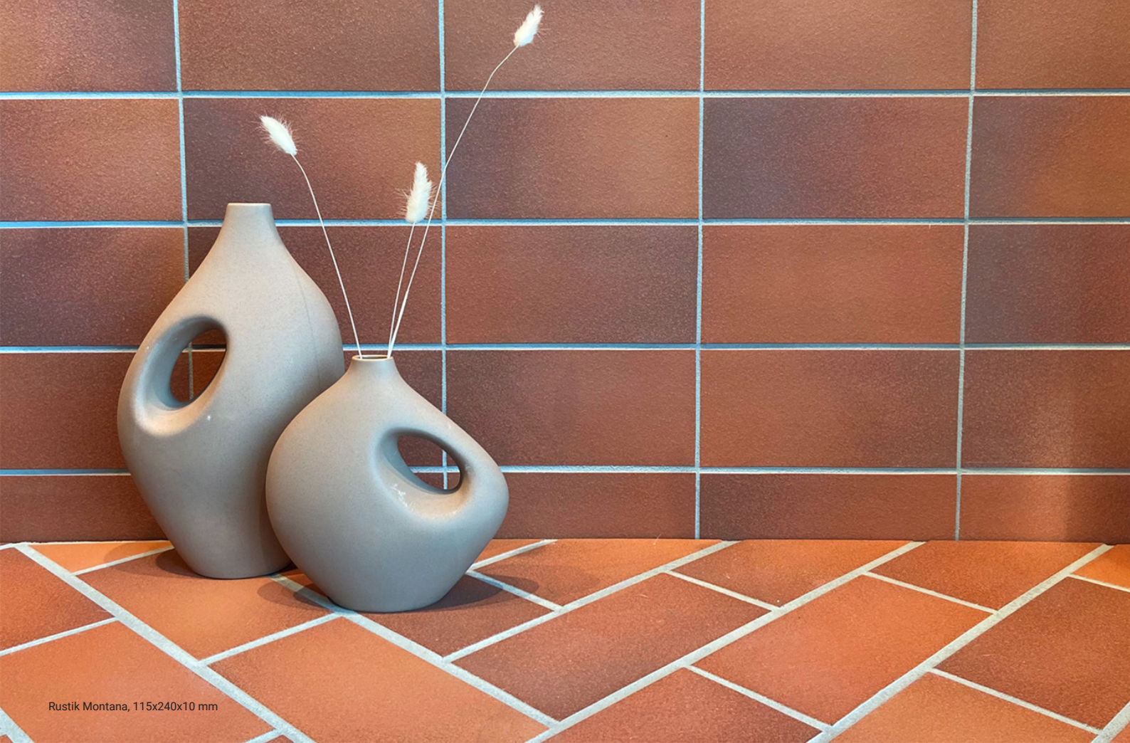
Rustik Montana, 115x240x10 mm