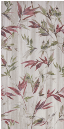
1880-0015 Fabulous Pink