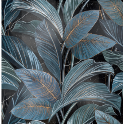
1880-0002 Black Leaf (A + B Set 1200x1200 mm)