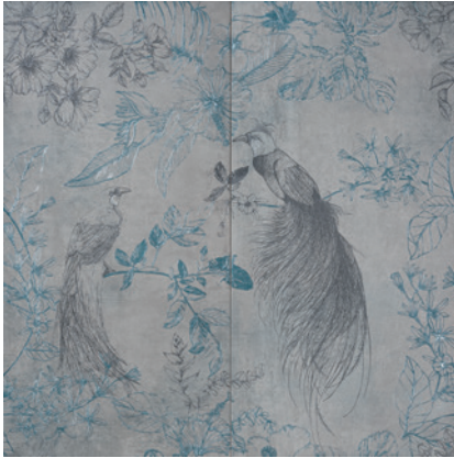
1880-0006 Fenice (A + B Set 1200x1200 mm)