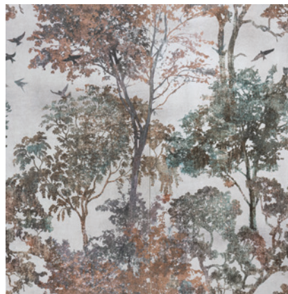
1880-0007 Forest (A + B Set 1200x1200 mm)