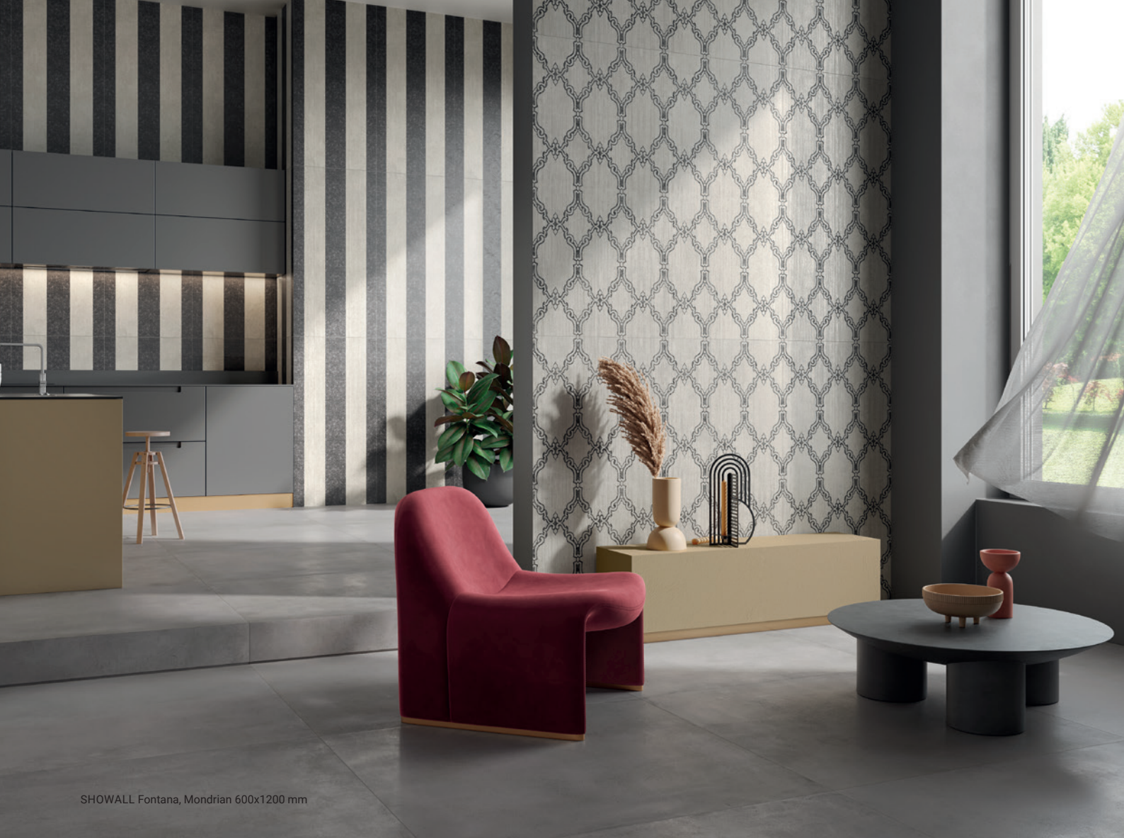
SHOWALL Fontana, Mondrian 600x1200 mm