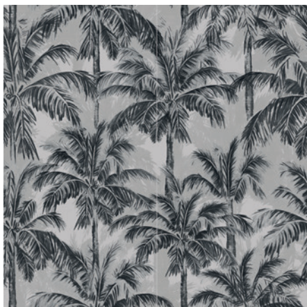
1880-0022 Palm Beach (A + B Set 1200x1200 mm)