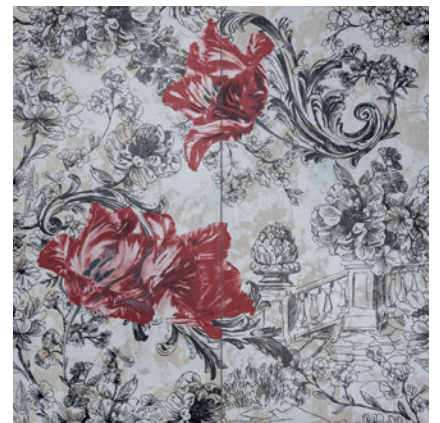
1880-0009 Romeo & Juliet (A + B Set 1200x1200 mm)