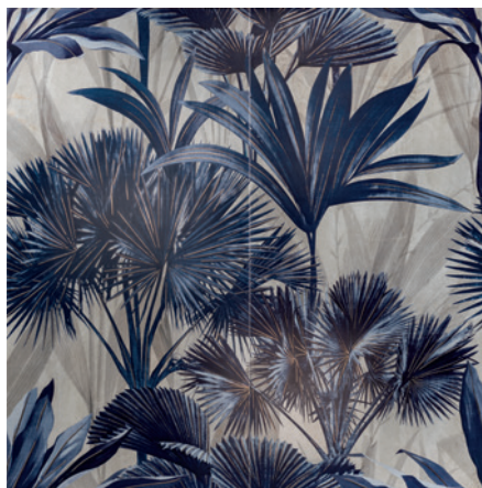
1880-0018 Amazonia Blu (A + B Set 1200x1200 mm)