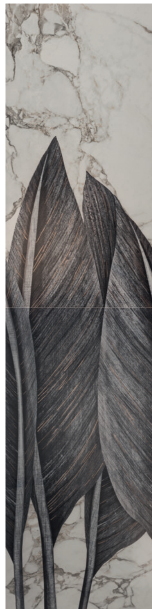
1880-0023 Odalisca (A + B Set 600x2400 mm)