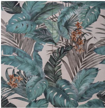
1880-0005 Jungle (A + B Set 1200x1200 mm)

Obs: vid köp av set A + B - tänk på att köpa ett paket extra för att inte sättningen ska bli fel, se ovan.