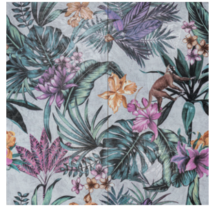
1880-0008 Monkey (A + B Set 1200x1200 mm)