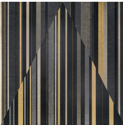
1880-0001 Hypnotic (A + B Set 1200x1200 mm)