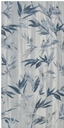
1880-0017 Fabulous Blue