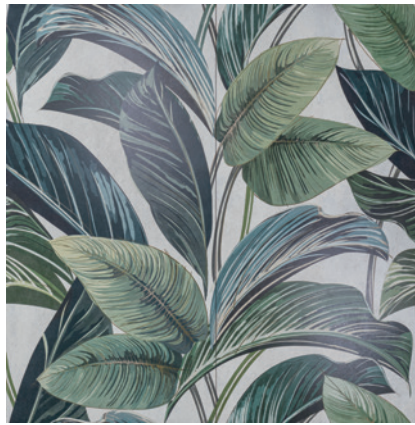
1880-0003 White Leaf (A + B Set 1200x1200 mm)