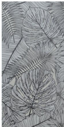
1880-0011 Myfair Grey