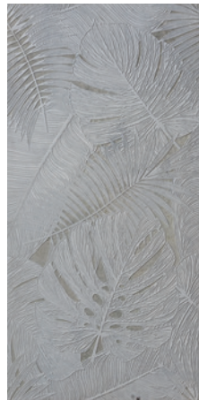
1880-0012 Myfair White