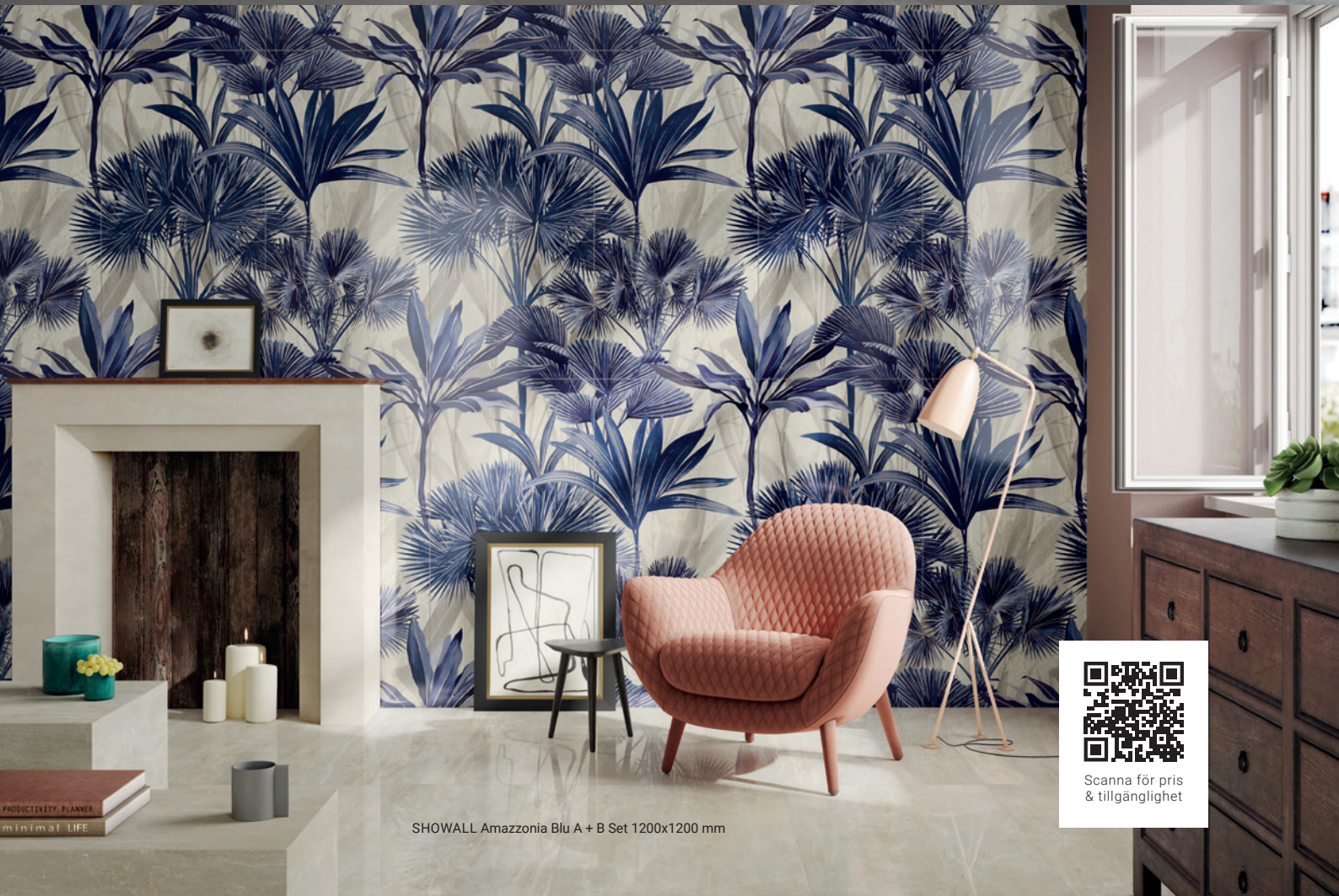
SHOWALL Amazonia Blu A + B Set 1200x1200 mm