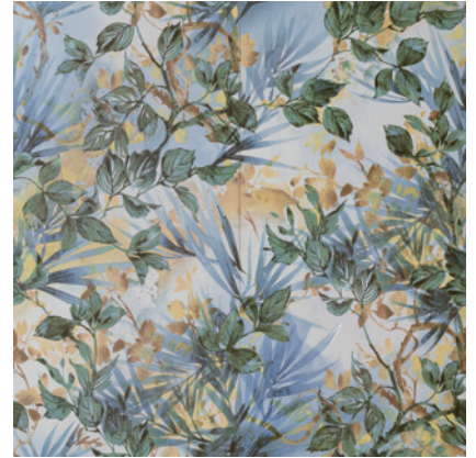
1880-0004 Garden (A + B Set 1200x1200 mm)